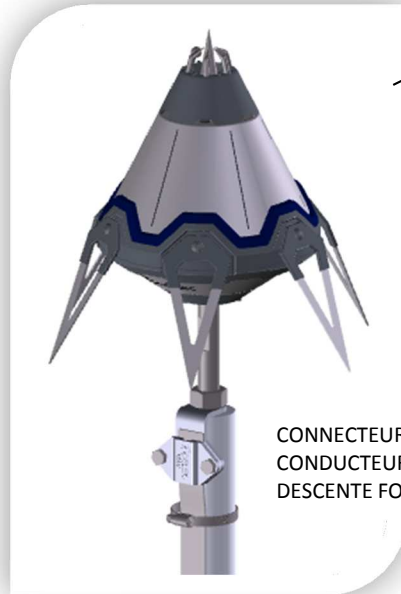
CONNECTEUR POUR CONDUCTEUR DE DESCENTE Foudre